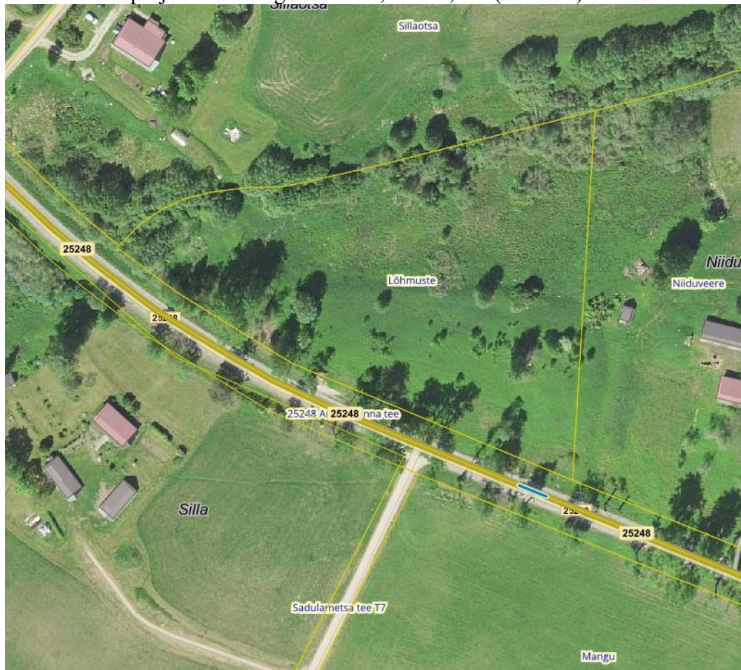
Joonis 1. Riigitee nr 25248 km 13,815-13,825, väljavõte Maa- ja Ruumiameti geoportaalist